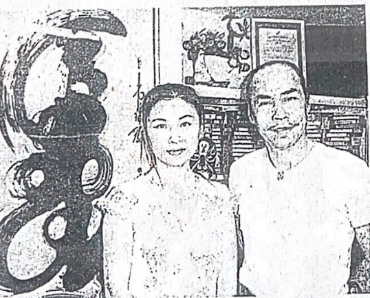
及鄭阿梅合作為志蓮淨院的老人家表演變臉

藝術是掩眼法，但變臉是變化，他的機關都在身上。」章瑞群說，變臉技術其實非常簡單，只要你懂得「機關」所在，但最難是守着它的「秘密」，並一直傳下去，令這項吸引不少人的變臉絕技，精彩之餘，充滿神秘感。