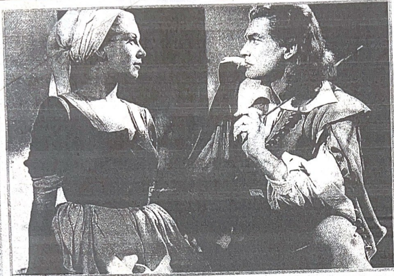
尚·高克多的作品《美女與野獸》是法國經典電影 【本報訊】法國名導演尚·高克多 (Jean Cocteau) 於一九四六年拍攝了不朽愛情經典電影《美女與野獸》(La Belle et la Bête)，被譽為二十世紀現代藝術運動的代表作。