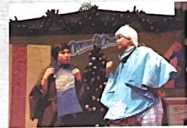
在海洋公園舉辦活動表演。