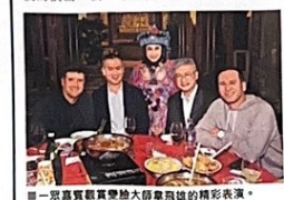
一票高爾夫球賽地大師賽飛越的精彩表演。

西亞亦與現場的中國香港高爾夫球協會（高協）的港隊年輕球員們揮桿打球、比賽心得，交談得甚為開心歡暢。