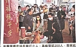
鵝頸橋底排長龍打小人，高峰時近200人，等候兩個小時。

龍打小人，等候兩個小時亦在所不惜，高峰時近200人在橋底，希望驅散晦氣、宣洩情緒。現場有警員駐守。大多市民都希望打小人後事事順利。