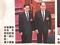
李家超昨日出席全國人大開幕式時，列席慶祝「一國兩制」實踐周年紀念大會。

長，形容「青年與則香港與、青年是香港的未來」，期望他們能擔當香港與內地合作的重要橋樑，北京市委常委楊晉柏、北京市政協副主委劉曉波、港澳僑務外事委員會主任趙宏生等均有出席活動。