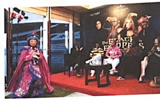
章飛雄說大部分人看到卡通通話時，都覺得又驚又喜。