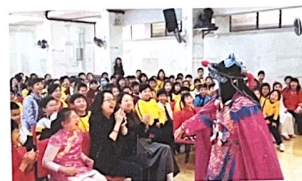
她不時會到香港各大校園推廣變臉文化，教育下一代。