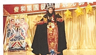
她表示變臉罕見的斗篷戲其實是由父親引入的，希望能讓表演更豐富，而傳統則會以鋼鐵神戲。